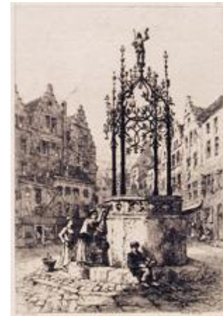
ANTWERP Well-Cover by Quentin Matsys